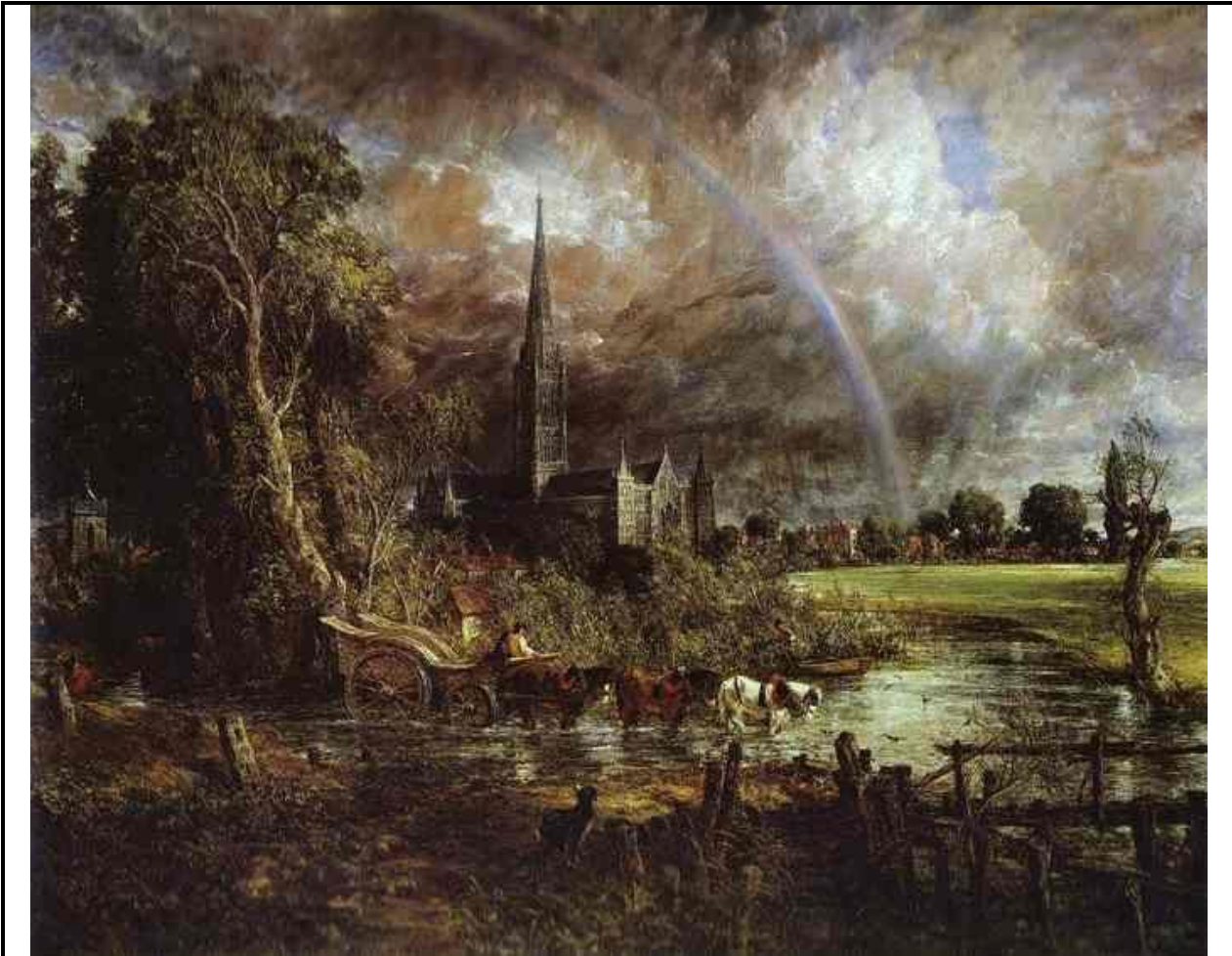
John Constable; Salisbury-katedraal vanaf 'n weiveld ; olie op doek; 150 cm x 180 cm

'Die golwende wolke is dreigend en onstuimig, die kontras tussen lig en skadu is oordrewe, en om die toringspits van die katedraal flits selfs weerlig. 'n Mens voel ongerus en dink aan ontsag, grootsheid – sowel as aan iets meer ontasbaar, majestueus en selfs onaards.'