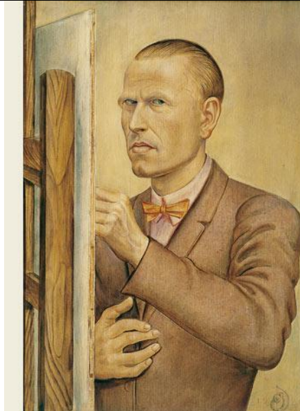
Otto Dix, Autorretrato con caballete ; 1926; olie op doek; 80,5 cm x 55,5 cm